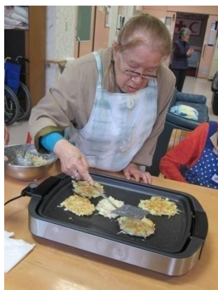
デイサービスではお好み焼き作りにチャレンジ

長く寒い冬は屋内で行っていた行事も、あたたかな春を迎えて皆さんと屋外に飛び出しました。