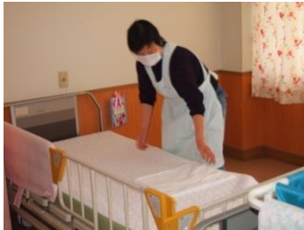
しわ一つないベッドが仕上がります

清潔な寝具は、健康な生活の第一歩です。リネン交換という活動は、ご利用者様の健康を支える、とても大切な活動です。