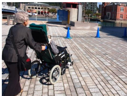
車いすを押しながらどんな会話をされているのでしょうか・・・

8月30日、88歳の誕生日に豊寿園へお世話になることになって現在に至ります。豊寿園に入所が決まった時は、やっと落ち着く所が見つかったと安心したのと同時に、主人は今後ずっとこの豊寿園で生活するのだなど、悲しい様な、ホツとした様な複雑な気持ちで、私は豊寿園の正面玄関で立ちすくんだまま、一点をぼやーっと見つめていました。 今でも毎日面会に行っています。土、日は娘に主人の面倒を見て貰って、月曜から金曜を、私の主人との会話の日にしていきます。 左手では上手に食事が出来ないのでも食事の手伝いをしたり、おしゃべりの相手を少しでも淋しい気持ちと心を和らげてやりたいと心掛けています。