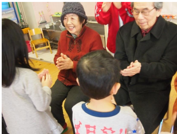
かわいい園児さんとのふれあいに笑顔がこぼれます