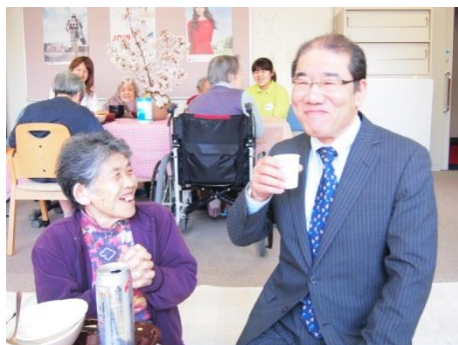
ご利用者様からのお酌で、花見酒に舌鼓