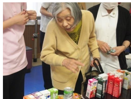
出張売店でお買い物 どれにしようかな