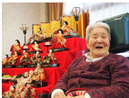
おひなさまと一緒に記念撮影